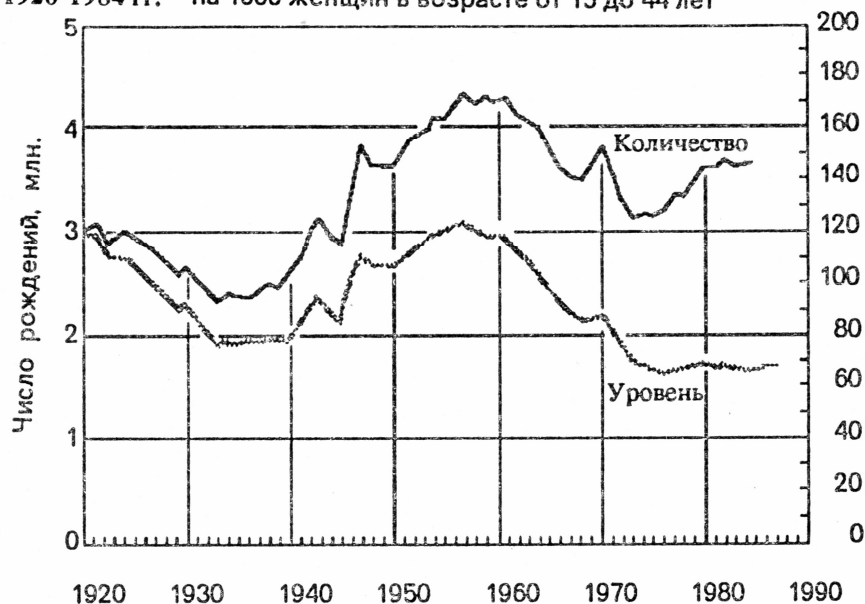
Схема 18-6. Число рождений и уровень фертильности в США, 1920-1984 гг. на 1000 женщин в возрасте от 15 до 44 лет

Примечание. Начиная с 1959 г. данные о главных тенденциях основаны на регистрации живых новорожденных, данные 1920-1959 гг. основаны на учете незарегистрированных сведений.