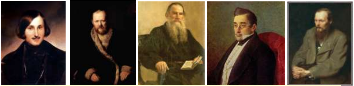
Портрет Гоголя . Моллер Федор Антонович. 1841. В Третьяковской галерее авторская копия того же года.