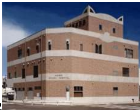
Детский сад. Проект художника Томи Унерера (Франция), архитектор Алья-Сюзани Йондел