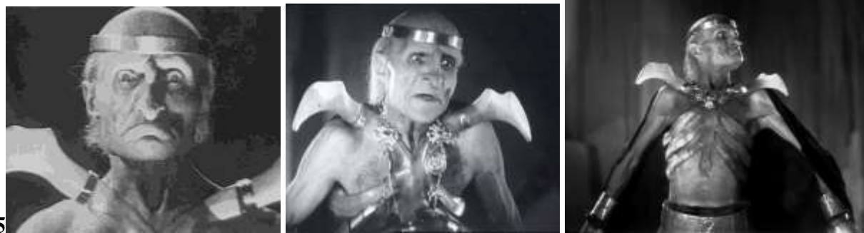
Фильм назван именем персонажа на иллюстрациях.