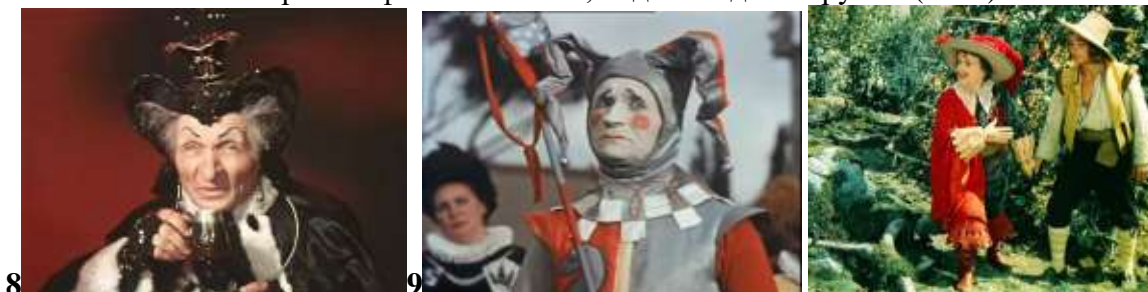
Старая колдунья. Шут в к/ф "Новые похождения Кота в сапогах" (1958)

I. Вставьте номера иллюстраций и имена персонажей в текст в отведенных для них местах.