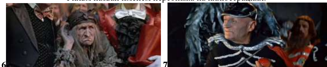
Те же образы в фильме "Огонь, вода и медные трубы" (1968)