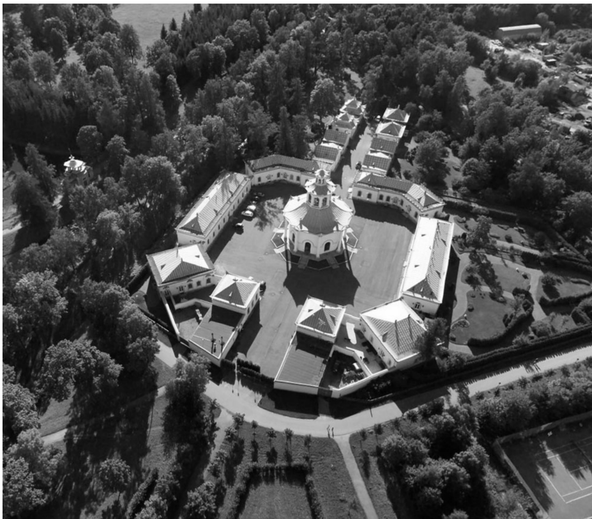
Китайская деревня. Ворота