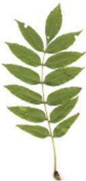
д) Ясень обыкновенный