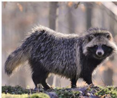
б) Собака енотовидная