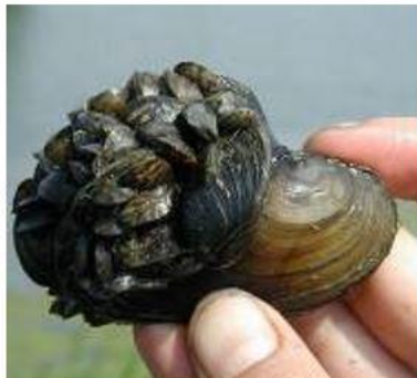
а) Речная дрейссена

Выберите виды-интродуценты, которые прежде не встречались на Европейской территории нашей страны.