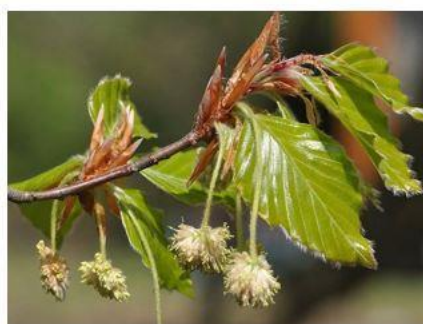
г) Бук лесной