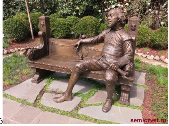
Вариант изображения 4