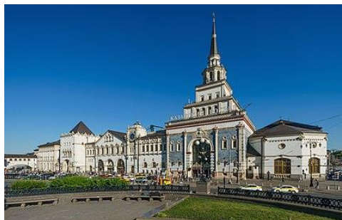
1 - 1а.