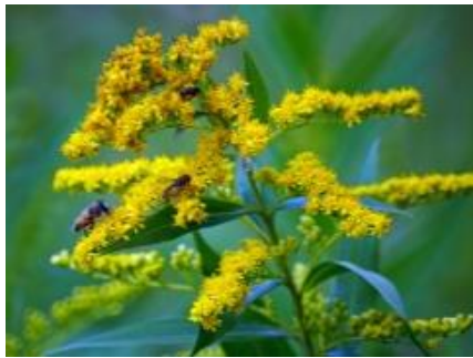
а) Золотарник канадский

На фотографиях представлены виды-интродуценты. Отметьте инвазивные для европейской части России виды.