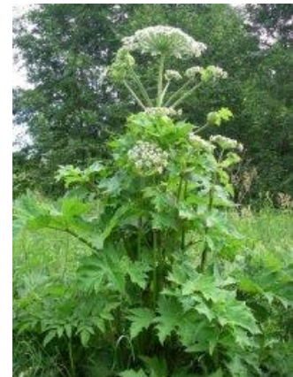
е) Борщевик Сосновского