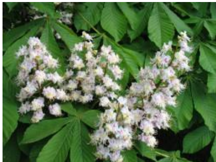
г) Каштан конский