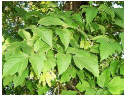
б) Ясенелистный (американский) клён