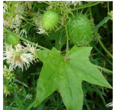
в) Колючеплодник лопастной