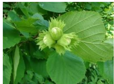
е) Орешник (лещина обыкновенная)