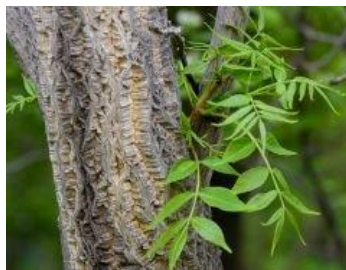
д) Бархат амурский