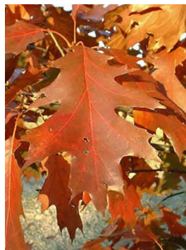
б) Дуб красный