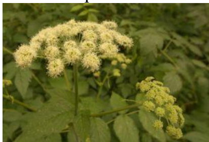
г) Дудник лесной