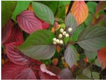
а) Свидина кроваво-красная

Выберите виды-интродуценты для Европейской части России.