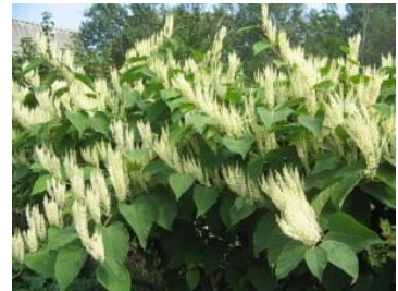
в) Гречиха сахалинская