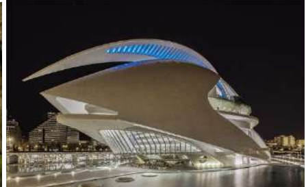
Библиотека Канзас-Сити (Миссури, США) Идеальный дворец (Франция). Дворец искусств королевы Софии (Валенсия, Испания).