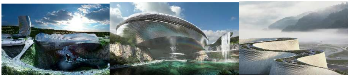
Горный комплекс Доуанг Китай.