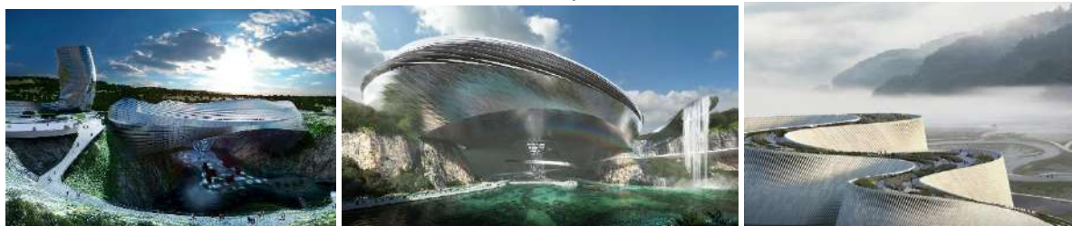
Горный комплекс Доуанг Китай. Проект музея естественной истории в Шеньджене в виде волны с прогулками по крыше