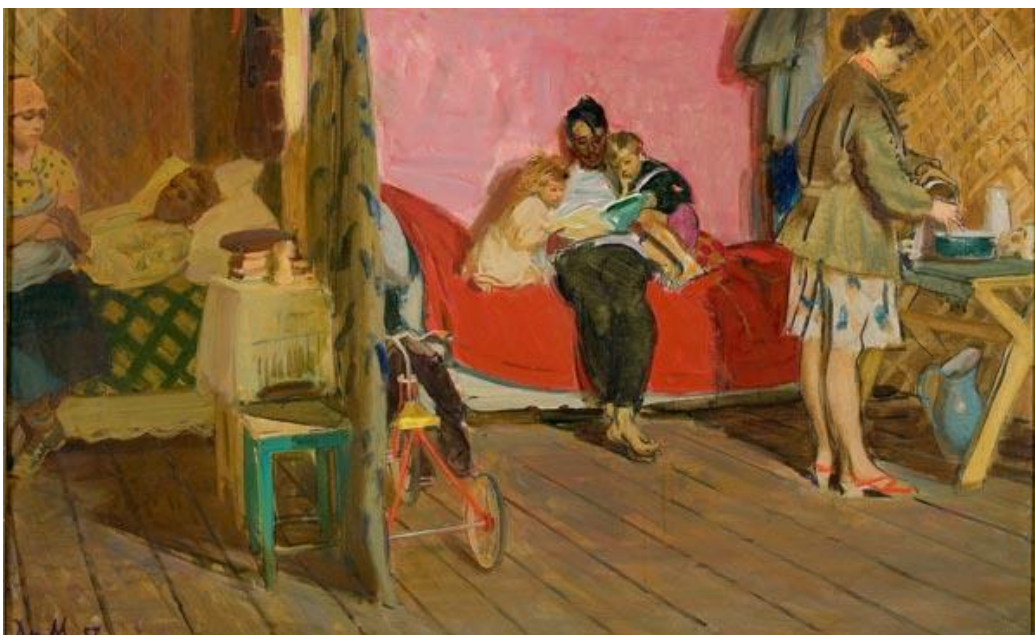
Д. Мочальский. «Новосёлы. Из палатки в новый дом» (1957)

Задание 2. Отметьте все верные утверждения, основываясь на изображении.