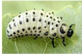
личинка жука листоеда

Пищевая цепь в степном биоценозе включает 4 организма. Постройте схему пищевой цепи.