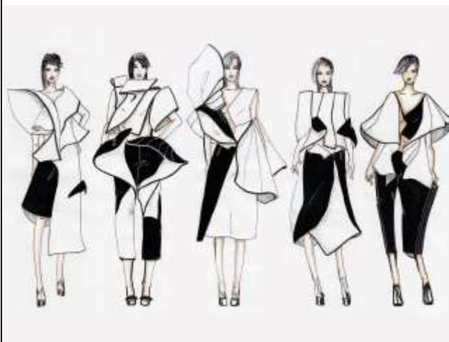
Примерный эскиз 1