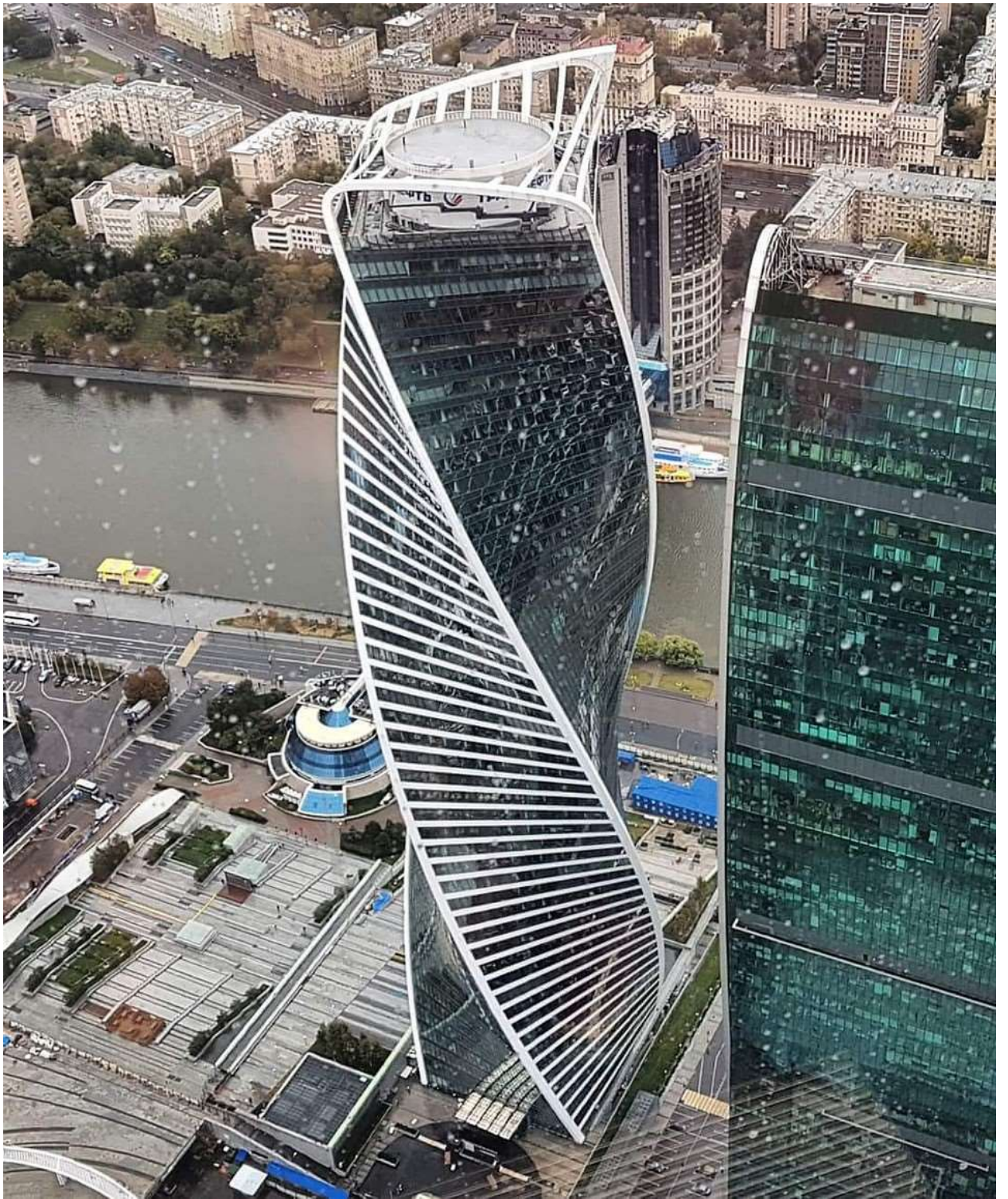
Рис. 1. Башня «Эволюция»