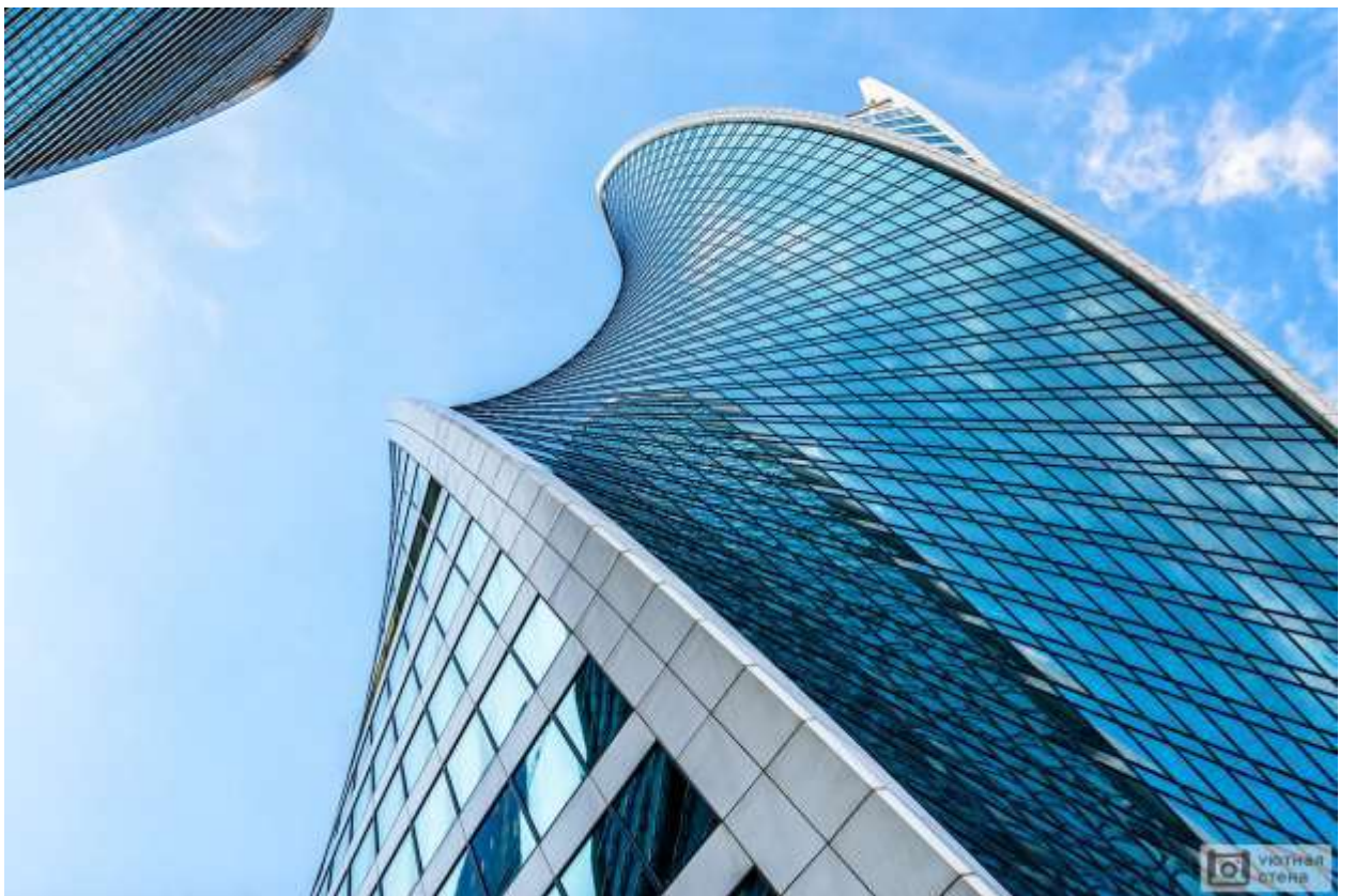
Рис. 3. Фрагменты декора фасада