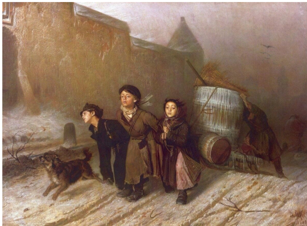
В. Перов. «Тройка»

Рассмотрите иллюстрацию картины В. Перова «Тройка».