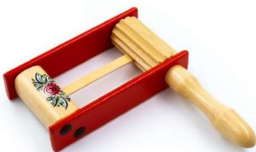
Рис.1 – Музыкальный инструмент «Трещотка»

Изделие: Модель музыкального инструмента «Трещотка»