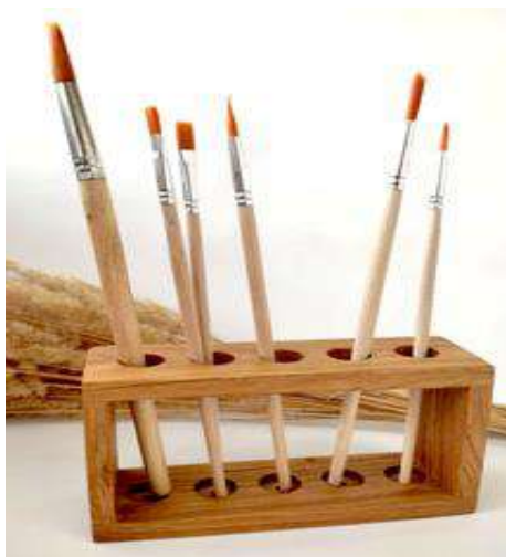
Рисунок 1. «Подставка для кисточек»

Габаритные размеры изделия: 10x40x90 (мм). Предельные отклонения размеров \pm 1 мм.