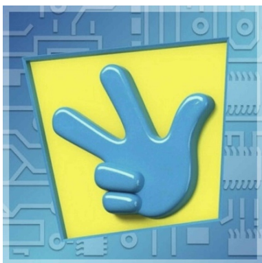
Рис.1. Образец знака