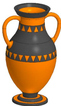
Рис.2. Пример 3D-модели изделия