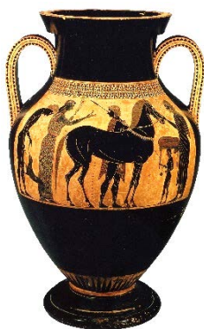
Рис.1. Образец вазы с узором