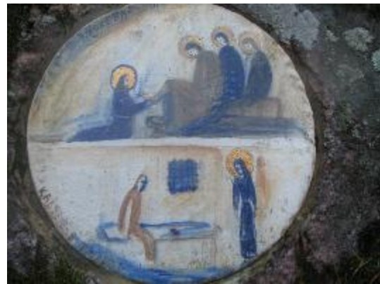
10. Медальон южной стены. Омывение ног и посещение Елизаветой Фёдоровной Каляева в тюрьме