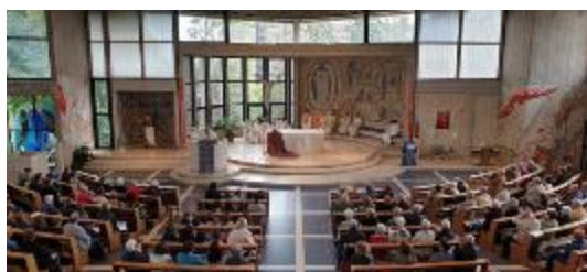
3. Церковь Сант Уго в Риме. Интерьер во время службы