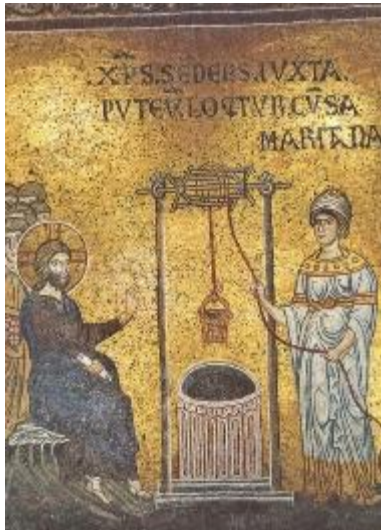
Христос и самарянка у колодца. Мозаика собора в Монреале в Италии. XII в.