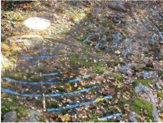
5. Часовня в Йорвасе. Декорация пола