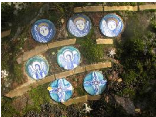
15. Медальоны восточной стены. Ангелы