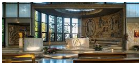
4. Церковь Сант Уго в Риме. Интерьер с мозаикой А.Д. Корноухова