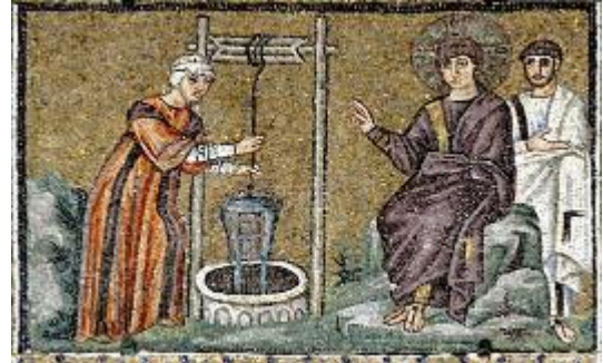
Христос и самарянка у колодца. Мозаика базилики Сант-Аполлинаре- Нуово в Равенне. Италия. VI в.