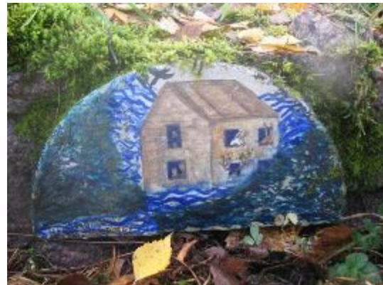
14. Керамическая вставка на западной стене. Ноев ковчег