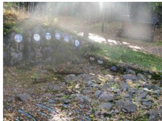
8. Часовня в Йорвасе. Вид на угол южной и западной стены