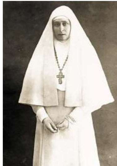
18. Фотография Елизаветы Фёдоровны в одежде сестёр Марфо-Мариинской обители. 1918 г.

Опираясь на эти и другие вопросы, которые покажутся Вам важными, напишите эссе «Новый христианский язык в декорации часовни Елизаветы Фёдоровны в Йорвасе».