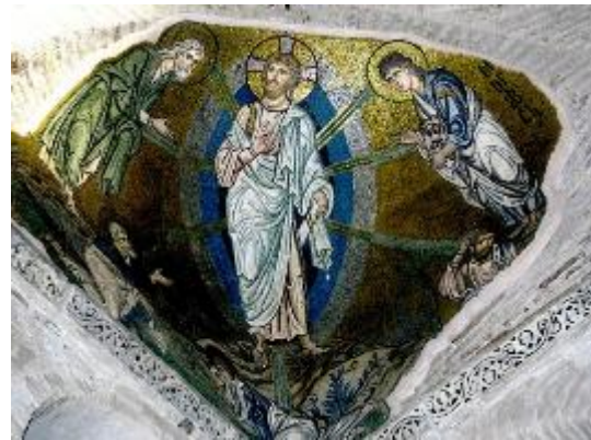
Преображение на горе Фавор. Мозаика монастыря Дафни. Нач. XII в.