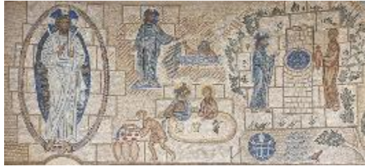
5. Мозаика. Общий вид