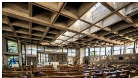
2. Церковь Сант Уго в Риме. Интерьер