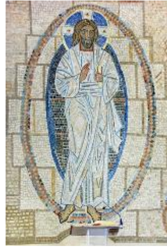
6. Мозаика. Фрагмент 1