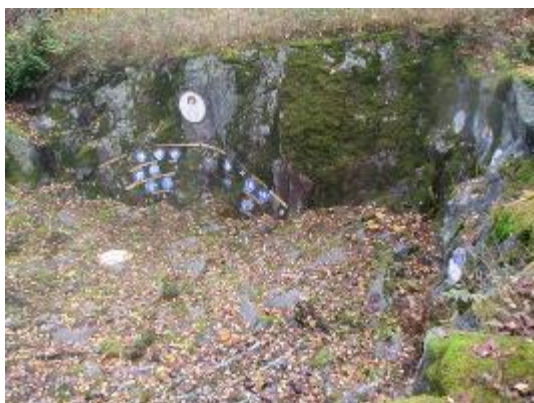
1. Часовня в Йорвасе. Общий вид

Постарайтесь обобщить свои наблюдения и прийти к выводу, который бы их суммировал.