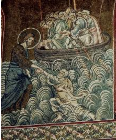
Спасение Петра. Мозаика собора в Монреале в Италии. XII в.