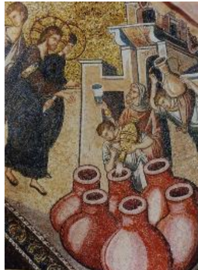
Чудо в Кане Галилейской. Мозаика в Кахрие-джами. XIV в.