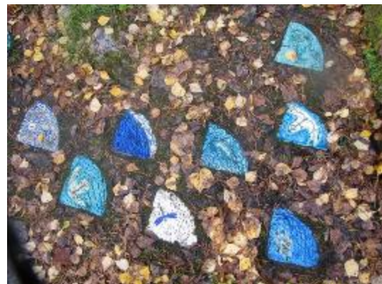
16. Керамические вставки, украшающие пол