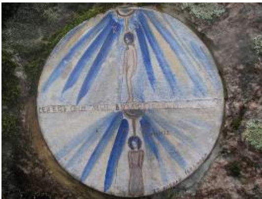
9. Медальон южной стены. Крещение