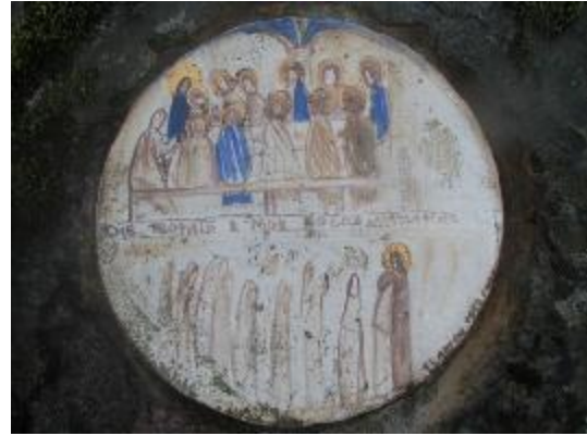
12. Медальон южной стены. Тайная вечеря и прощание Елизаветы Фёдоровны с сёстрами Марфо- Мариинской обители