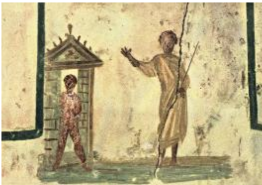
Воскрешение Лазаря. Фреска из катакомб Сан-Каллисто в Риме. III в. н.э.

В качестве вспомогательного материала в задании даны примеры раннехристианских фресок из катакомб и средневековых мозаик.