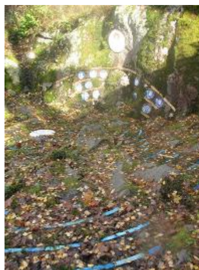
2. Часовня в Йорвасе. Вид на пол и восточную стену