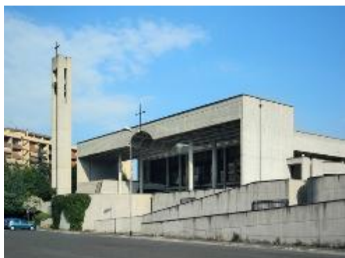
1. Церковь Сант Уго в Риме. Внешний вид

В этом задании мы обратимся к искусству мозаики и попытаемся проанализировать замечательный пример современного монументального искусства, выполненный для римской церкви Сант Уго российским художником и мозаичистом Александром Давыдовичем Корноуховым (р. 1947). В советское время Корноухов оформлял мозаичными панно дома культуры и санатории, но буквально с началом перестройки обратился к храмовому искусству. Во второй половине 1980-х и 1990-е годы он создал отдельные мозаики и целые мозаичные ансамбли для церквей в Тбилиси, Москве, Иерусалиме, Риме и Ватикане. Нас будет интересовать церковь Сант Уго в Риме, для которой Корноухов сделал мозаику в 1996 году.