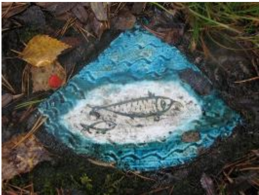
17. Керамические вставки, украшающие пол. Рыбы