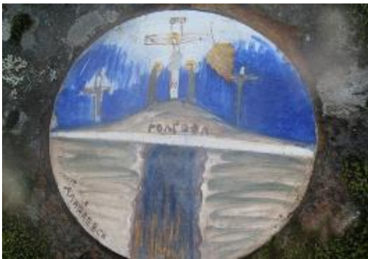
13. Медальон южной стены. Голгофа и шахта в Алапаевске