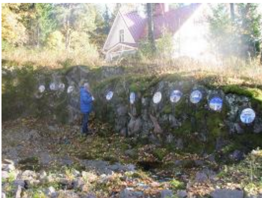
7. Часовня в Йорвасе. Вид на южную стену с медальонами