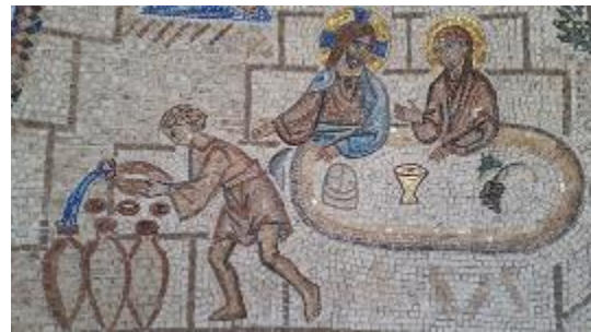
8. Мозаика. Фрагмент 3