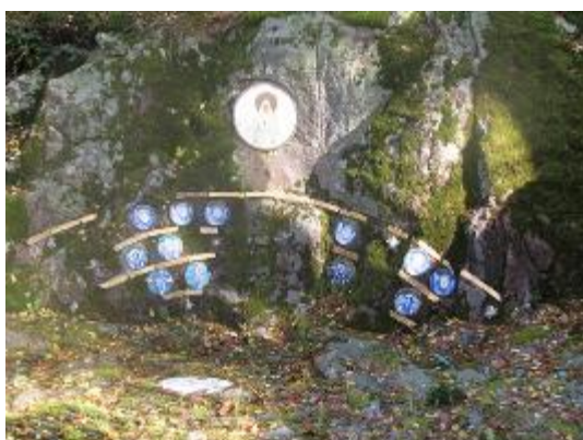
3. Часовня в Йорвасе. Вид на восточную стену