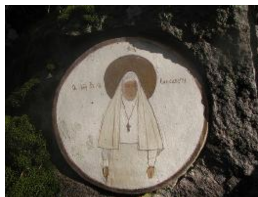
4. Часовня в Йорвасе. Медальон с изображением Елизаветы Фёдоровны на восточной стене