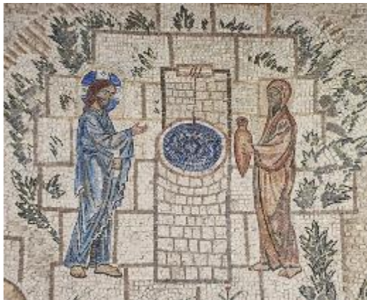
9. Мозаика. Фрагмент 4