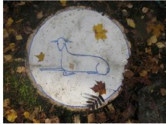
6. Часовня в Йорвасе. Медальон с агнцем в центре пола