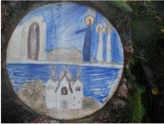
11. Медальон южной стены. Воскрешение Лазаря и основание Марфо-Мариинской обители