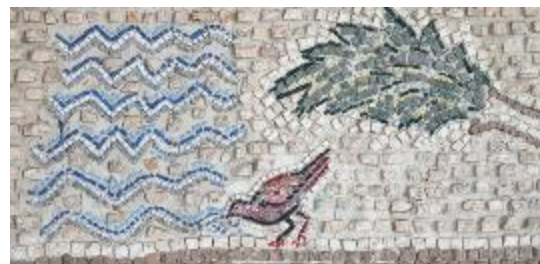
10. Мозаика. Фрагмент 5

Храм Сант Уго – это церковь, выстроенная из стекла и бетона в 1989–1991 годах. Она располагается на холме в современном квартале Солариа Нуова на севере Рима. Рядом и одновременно с храмом возник целый комплекс построек: общежитие для священников, клубы по интересам для жителей района, открытые эстрады и сады. Здание церкви было частью этой новой социальной структуры и внешне было мало связано с традициями итальянского храмового зодчества. Сам Корноухов говорит об этом так: «Архитектурная идея, как я её понимаю, в данном случае была не создать церковное здание, а создать вместилище современных людей».