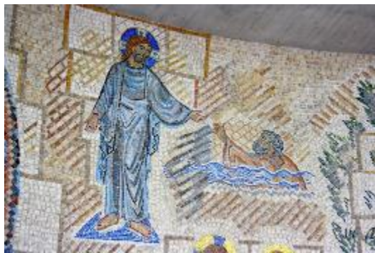
7. Мозаика. Фрагмент 2