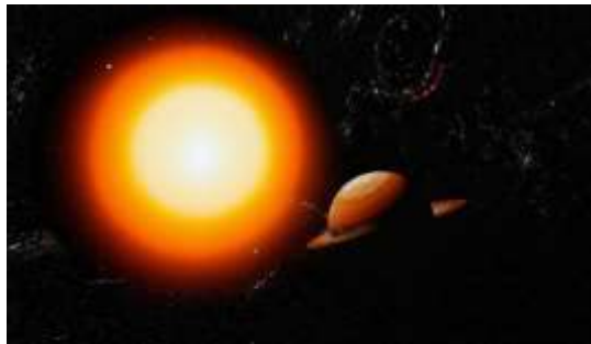
Изображение сгенерировано моделью Kandinsky 3.1

Планеты А и Б обращаются вокруг красного карлика по круговым орбитам в одной плоскости и в одном направлении. Периоды обращения планет равны 1 земному году и 3 земным годам соответственно.