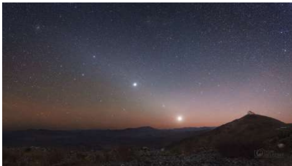
Планеты Венера, Марс и Юпитер на предрассветном небе 2

Посмотрите внимательно на «групповой портрет» Солнечной системы. В одну цепочку на снимке выстроились планеты Венера, Марс и Юпитер, а также звезда Регул ( \alpha Льва).