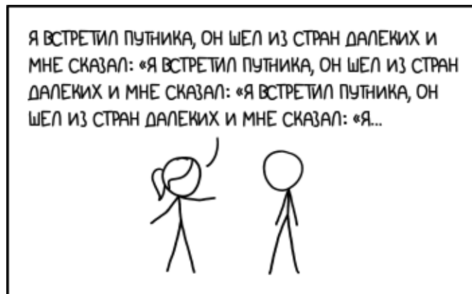
Шутка по теме задачи 3

Очень быстрый самолёт летит вдоль экватора Земли с запада на восток. Длина окружности земного экватора – около 40 тысяч километров.