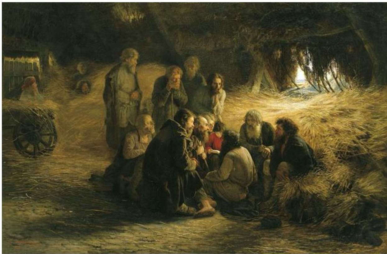
Григорий Мясоедов «Чтение Положения 19 февраля 1861 года». Государственная Третьяковская галерея, Москва.

39–42. Внимательно рассмотрите приведённое изображение.